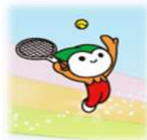
大会マスコットキャラクター 「ちよるる」