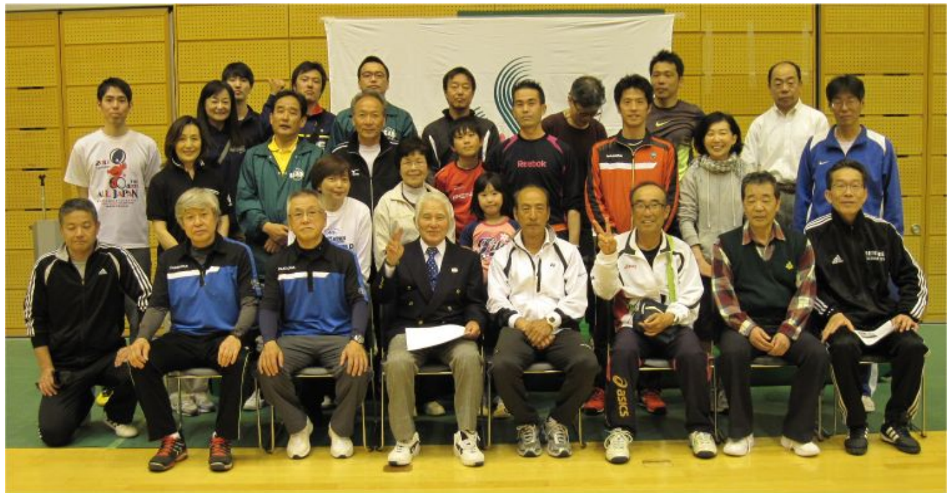
サッカー・テニス・バスケット合同 優勝チーム